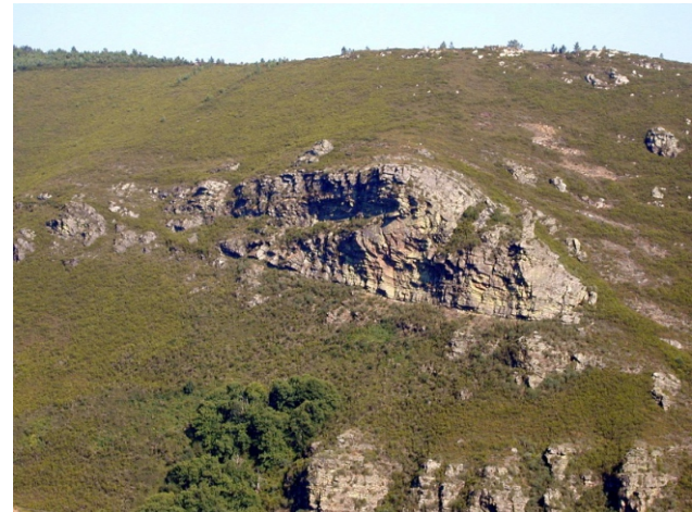
Pregue de Campodola.

O Courel é un auténtico museo de xeoloxía. En distintos puntos podemos contemplar pregamentos e fallas nos estratos do terreo que son unha testemuña das forzas que crearon e erosionaron estas montañas durante millóns de anos. O máis importante é o de Campodola que é un dos maiores monumentos xeolóxicos da Península Ibérica. Mide máis de 2 km e está formado por capas de xistos e cuarcitas.