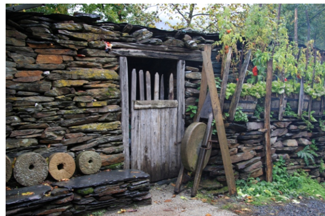
Museo etnográfico de Vilar, de entrada libre, a cambio de apagar a luz ao marchar e, se se quere, deixar unha axuda para costar o seu mantemento.

O Courel é un auténtico museo de xeoloxía. En distintos puntos podemos contemplar pregamentos e fallas nos estratos do terreo que son unha testemuña das forzas que crearon e erosionaron estas montañas durante millóns de anos. O máis importante é o de Campodola que é un dos maiores monumentos xeolóxicos da Península Ibérica. Mide máis de 2 km e está formado por capas de xistos e cuarcitas.