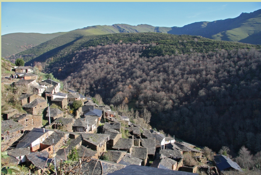
Outeiro, pola súa orientación, goza das raiolas de sol nos días de inverno.

A seguinte poboación é Soldón , que lle da nome a río, e, un pouco máis adiante, no Mazo vense os restos dunha ferrería e o val do rego do Montouto coa serra dos Cabalos . Seguindo polo val do Soldón chegamos a Cruz de Outeiro desde onde podemos ver a poboación de Outeiro e o seu fermoso souto, ou achegarnos á pincheira da Pedriña no río de Vilarbacú . A partir de aquí deixamos o val do Soldón e seguimos o val do río Quiroga , coa serra do Courel á dereita, nunha área moi alterada polas canteiras de lousa. Despois de numerosas curvas e moitas vistas panorámicas, un pouco antes de baixarmos ao val de Quiroga, podemos ver a parte de atrás do pregue de Campodola . A ruta remata cando nos incorporamos, xirando á esquerda, en dirección a Quiroga, á estrada que vai a Pacios da Serra. Un pouco antes de entrar en Quiroga podemos achegarnos a coñecer o conxunto histórico-artístico do Hospital . Finalmente chegamos de novo a punto de partida.