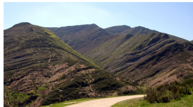
A disposición das rochas crea curiosas formas nas abas do monte Formigueiros que conforman o val de Visuña.