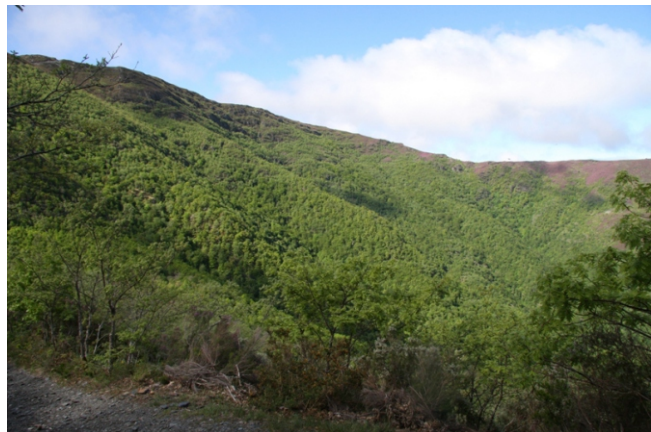
Devesa de Rogueira, declarada polo Fondo Mundial para a Natureza como unha das seis áreas de bosque autóctono máis importantes da Península Ibérica. É a devesa máis extensa e famosa de Galicia. Por riba dos 1.000 m hai faias acompañadas de acivros e teixos.